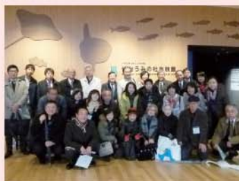
仙台うみの杜水族館