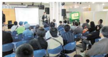
高校生による租税教室