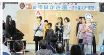
高校生による税金クイズ