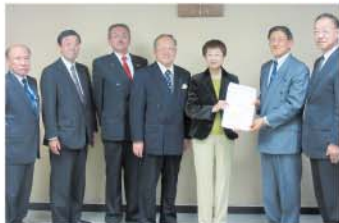
奥山恵美子仙台市長へ