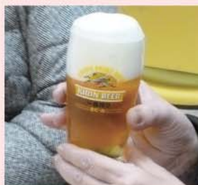
キリンビール仙台工場