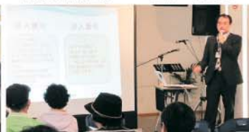
黒政健社会保険労務士