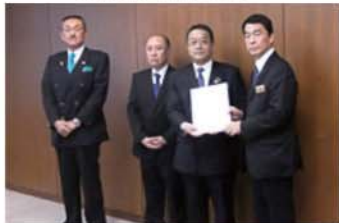
村井嘉浩宮城県知事へ

11月20日の秋葉衆議院議員を初めとして、奥山仙台市長、岡部仙台市議会議長、村井県知事、安藤県議会議長、及び管内に事務所を構える衆参国會議員3名対して平成28年度税制改正要望等の陳情を行いました。