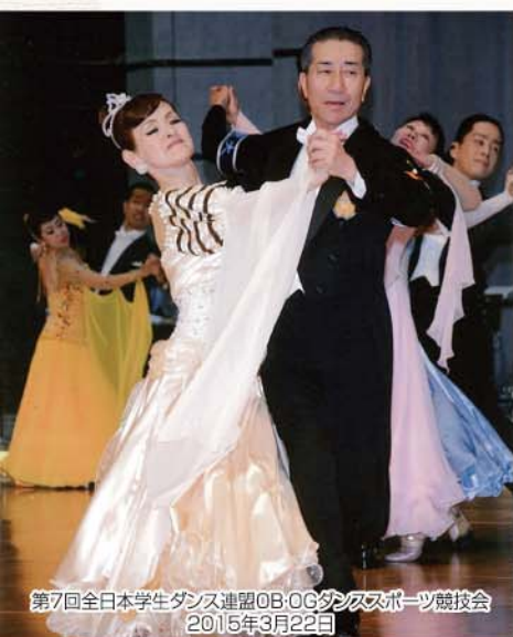
第7回全日本学生ダンス連盟OB・OGダンススポーツ競技会 2015年3月22日

Aflac アフラック(アメリカンファミリー生命保険会社) 仙台総合支社 〒980-6122 仙台市青葉区中央1-3-1 アエル22階 法人会 0120-876-505