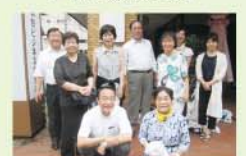
▲清掃活動後集合写真