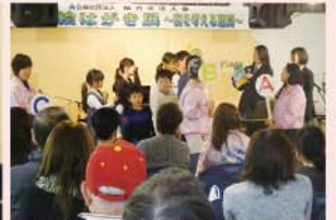
高校生による租税教室&税金クイズ