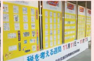
絵はがき展示風景