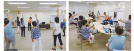
体内浄化エクササイズ