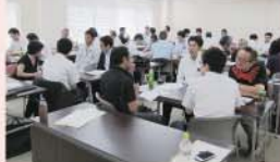
部下のほめ方・叱り方講座