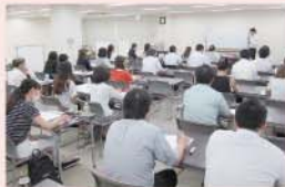
決算書の使い方セミナー

途中3・4人のグループに分かれてのグループ討議や発表などをまじえながら、部下の「ヤル気」と「成長」を促し、職場環境を飛躍的にアップさせる「対話術」を伝授いただきました。