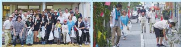
【ご協力企業様】(順不同・敬称略)

今年度で4年目となりました清掃活動は、大勢の観光客が来仙する七夕祭り前日の早朝に実施いたしました。地味で地道な活動ではありますが、この小さな積み重ねが少しでも仙台のイメージアップに繋がればと願うところです。